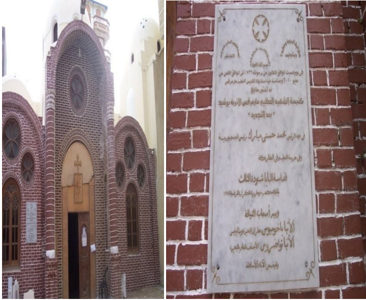
Fig 10- L'entrée principale de l'église