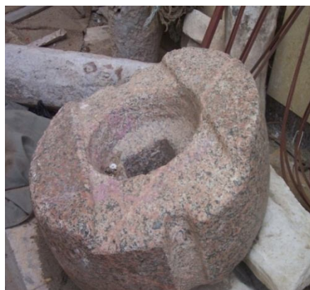
Fig 5- Un pressoir en granit