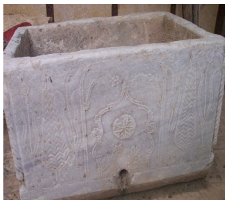
Fig 4- L'ancien baptisère en marbre