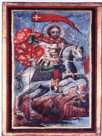
Fig 23 - L'icône de Saint Pierre et de Saint Paul Fig 24 - L'icône de Mari Tadrus El Machraqui