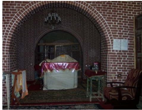
Fig 14- Les reliques de Saint George l'alexandrin Fig 15- L'autel de la Vierge Marie et de Saint Abanub