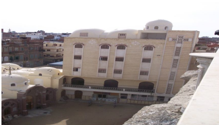
Fig 9- la maison Abu Maqar