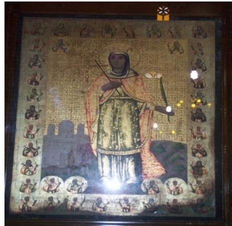
Fig 20 - L'icône de Sainte Demiana et les 40 vierges