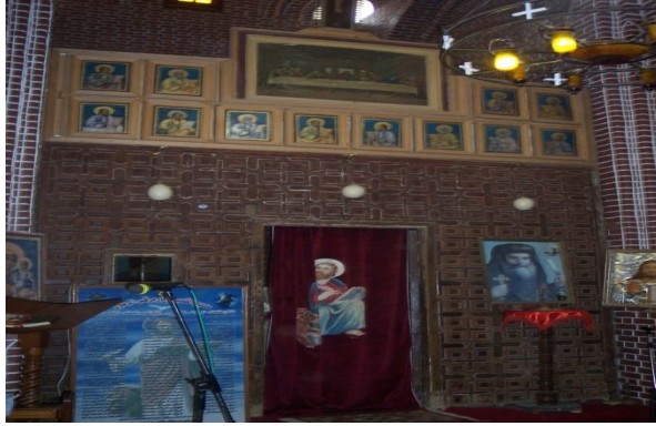
Fig 13- L'iconostase du sanctuaire centrale dédiée à Saint Marc