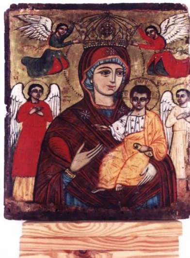
Fig 21 - L'icône rare de Saint Marc Fig 22 - L'icône du couronnement de la Vierge Marie