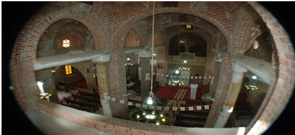
Fig 12- Les quatre anciennes colonnes soulèvent la nef centrale de l'église