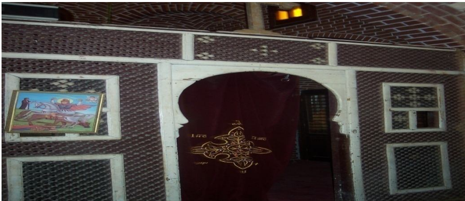
Fig 18- Le haikal consacré aux sept Archanges