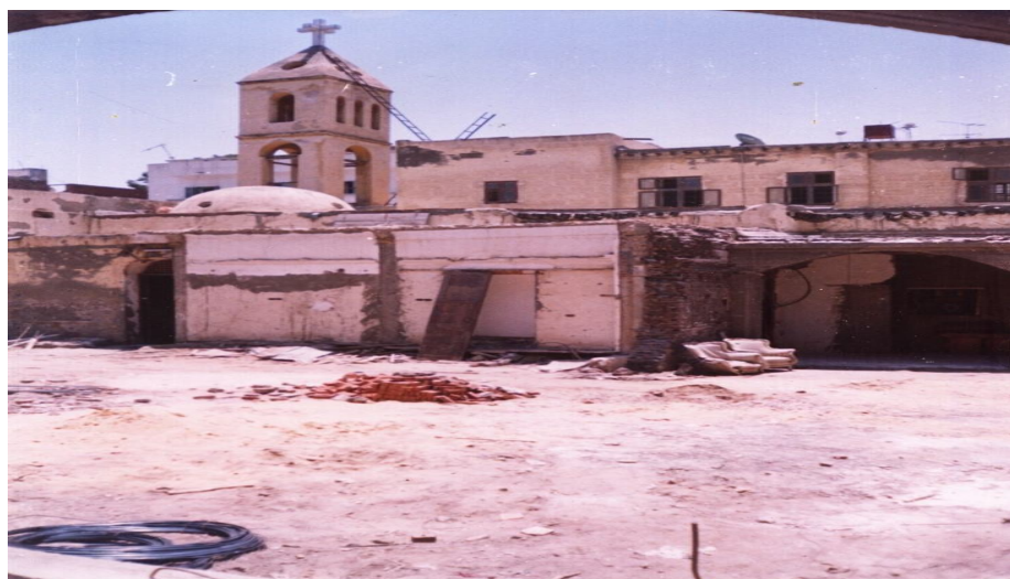
Fig 2- L'aspect de l'église actuelle avant les dernières restaurations