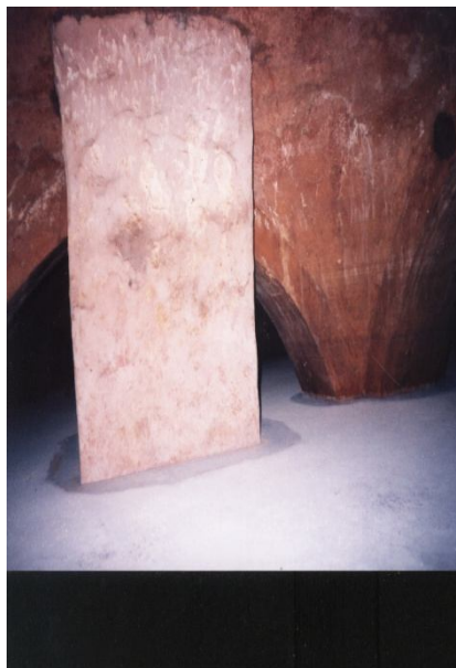
Fig 1- L'église originelle submergée