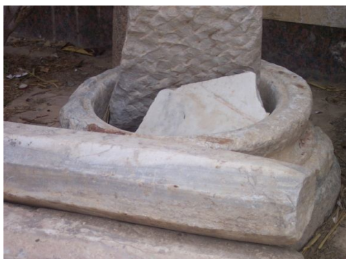
Fig 8- L'ancien Laqan en pierre