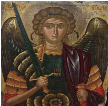
Fig 19- L'icône de L'Archange Michel