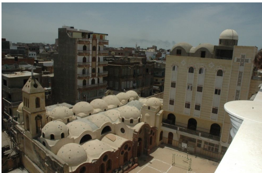
Fig 3- La cour de l'église, on remarque le bâtiment actuel de l'église et la maison Abu Maqar