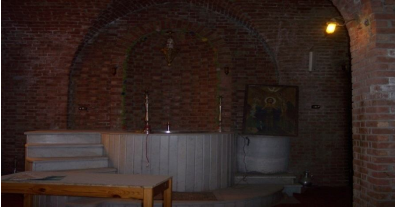
Fig 17- Le baptistère